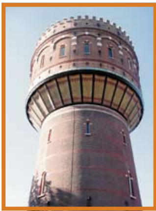
Voordat er aan de binnenzijde kon worden begonnen, is de Watertoren eerst aan de buitenkant compleet gerestaureerd.

Voor een nieuwe bestemming van de Watertoren uit 1895 in