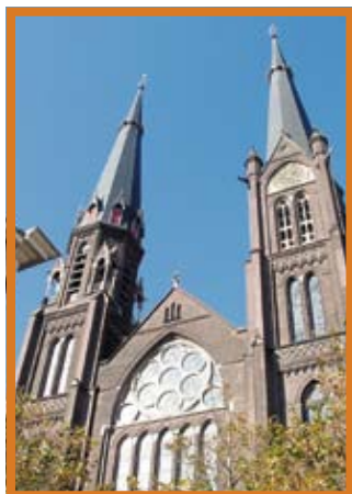
De voorgevel van de als kruisbasiliek gebouwde Maria van Jessekerk wordt geflankeerd door twee torens. De linker lijkt geïnspireerd op de toren van de Nieuwe en de rechters op die van de Oude Kerk van Delft.

BV dan ook heel wat werk verzet in en aan de kerk. Zo werden de altaarvloeren helemaal gerestaureerd. Er zijn heel wat luiken, ramen en kozijnen vervangen en het complete 'schip' en de gevels aan de interne zijde zijn gerestaureerd. "Tijdens het restaureren van deze kerk zijn ontzettend