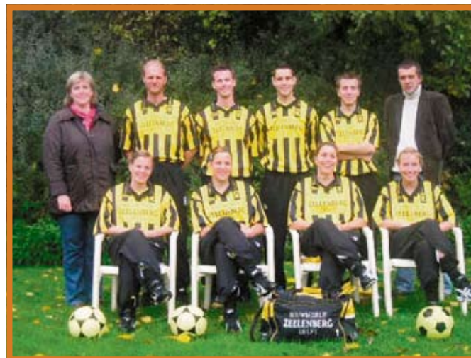
Het eerste team van DKC speelt nu alweer zes jaar met de naam 'Zeelenberg' op het shirt.