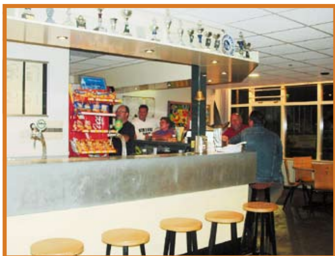
Bij de grote renovatie van het clubgebouw van DKC heeft Bouwbedrijf Zeelenberg BV onder andere gezorgd voor een compleet nieuwe bar.