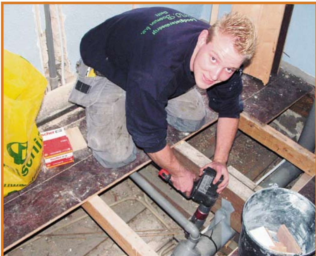
Loodgietersbedrijf B.W. Bosman is als onderaannemer bij vele grote werken van Bouwbedrijf Zeelenberg BV betrokken om het installatie- of loodgieterswerk te verzorgen.

Bouwbedrijf Zeelenberg BV werkt over het algemeen met een vaste groep onderaannemers. Eén daarvan is Loodgietersbedrijf B.W. Bosman. Hoewel dit bedrijf van Bruno en Cees Bosman alle klussen aankan die tegenwoordig van een modern installatiebedrijf gevraagd worden, heet het nog steeds gewoon loodgietersbedrijf. Ook voor ‘ambachtelijke’ klussen met het ouderwetse zink en lood kan dit bedrijf namelijk worden ingeschakeld. Een groot deel van het werk van Bouwbedrijf Zeelenberg BV bestaat uit het restaureren van oude gebouwen. Zeelenberg maakt dan ook optimaal gebruik van de kennis en kunde van Loodgietersbedrijf B.W. Bosman, dat in 1956 werd opgericht. “Al vanaf de begintijd hebben wij met Zeelenberg samengewerkt”, zegt Bruno Bosman. “Gerrit Zeelenberg is in contact gekomen met mijn vader en samen hebben zij vele ambachtelijke werken gerealiseerd. Dat de zakelijke relatie is uitgroeid tot een vriendschap